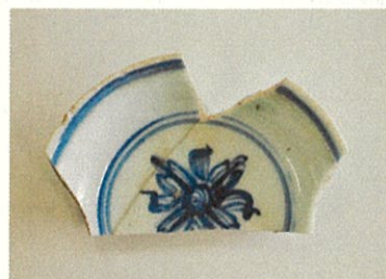
青花皿(中国・景德鎮窯産)