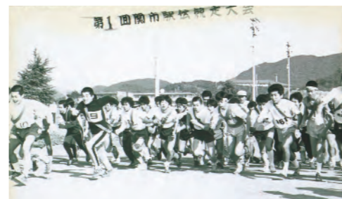
昭和58年、第1回関市駅伝競走大会を開催。