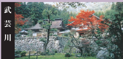
平成元年、NHK大河ドラマ「春日局」をきっかけに大勢の観光客が湧陽寺やゆかりの井戸、法泉寺、お局道などを訪れました。