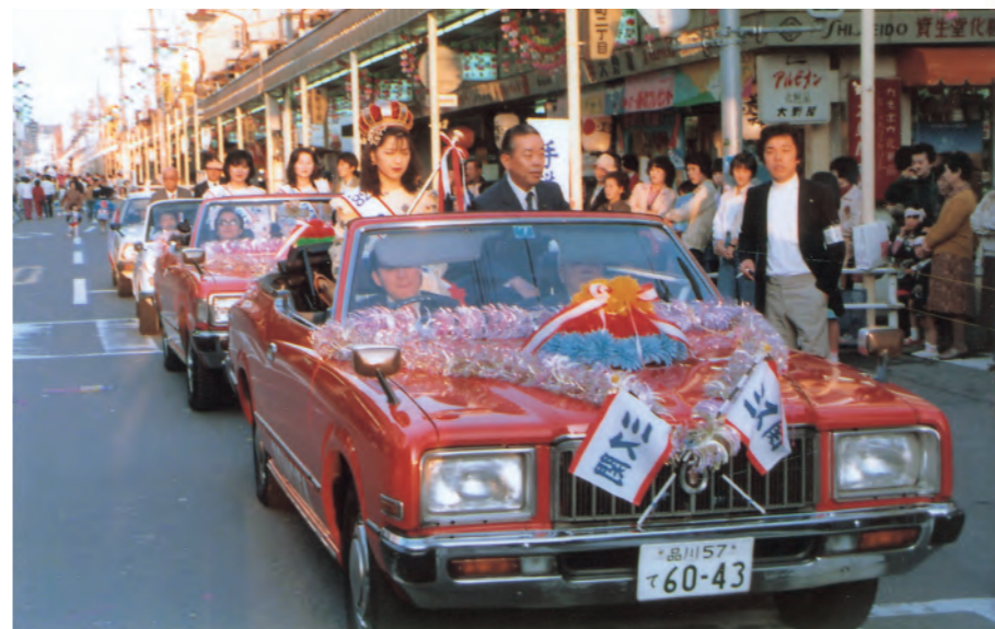
昭和57年、第1回ミス関を選出し関まつりで市中パレードを行いました。