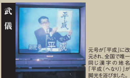
元号が「平成」に改元され、全国で唯一同じ漢字の地名「平成（へなり）」が脚光を浴びました。