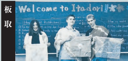
平成元年、アメリカ・アラスカ州ノースポール市と姉妹都市提携を締結、板取中学校3年生がアラスカ研修に行きました。