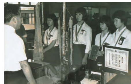
昭和57年、下有知中学校の女子剣道部が県大会優勝、全国大会で3位に入賞しました。