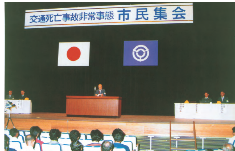
昭和58年、交通死亡事故非常事態市民集會を開催。