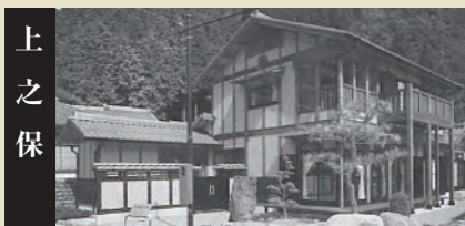
昭和60年、上之保村の製材建築業者が結束して「上之保デカ木住宅センター」が発足しました。