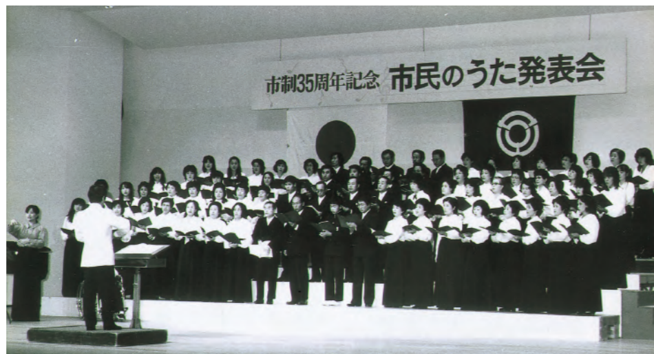
昭和60年、市制35周年を記念して関市民のうた「のぞみ新たに」を制定し発表。