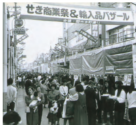
平成2年、せき商業祭&輸入品バザール(本町通り)で昭和63年～平成9年まで開催。