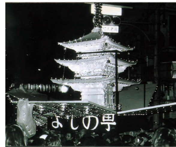
昭和59年の関まつり「あんどんみこしコンクール」の様子(昭和50年代の参加数は100基を超え、昭和54年には138基のみこしが練り歩きました)。