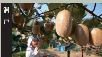
昭和56年、キウイフルーツ栽培導入後初めて実がつけました。