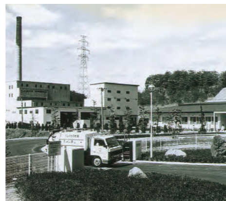
平成元年、中濃広域清掃センターに粗大ごみ処理施設が完成。