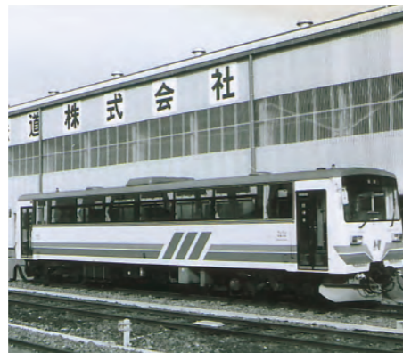
昭和61年、長良川鉄道が第3セクターとして開業。