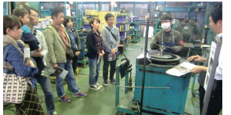
ものづくりを「見る・体験する」「関の工場参観日」初開催 17の市内企業が工場を開放し、普段は見られない職人の技を間近で見学・体験できるイベントを開催しました。