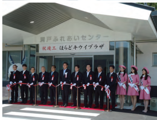
地域の新たな交流拠点施設竣工 住民の新たな交流拠点施設として、支所・事務所とふれあいセンターが入所する複合施設「西部コミュニティセンター」、「洞戸キウイプラザ」が完成しました。