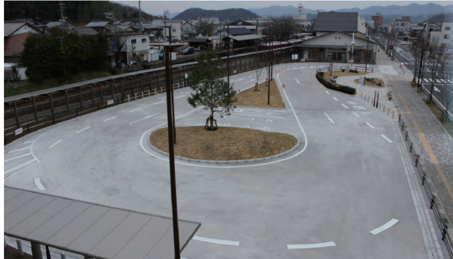
新しい市の玄関口「関シティターミナル」オープン 長良川鉄道とバスをつなぐ交通拠点として整備され、併設駐車場には災害時に利用する飲料水用備蓄槽や防災資機材備蓄倉庫を設置しました。