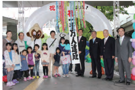
わかさ・プラザ来館者1,000万人を突破 平成11年にオープンしたわかさ・プラザの来館者が1,000万人を突破し、記念セレモニーを行いました。