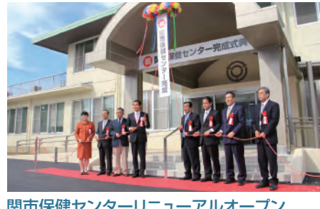
関市保健センターリニューアルオープン 保健センターを増改築し、診察室や健診用更衣室、こども待合コーナーなどを新設。健診バスが止められる屋根付き駐車場を併設しました。