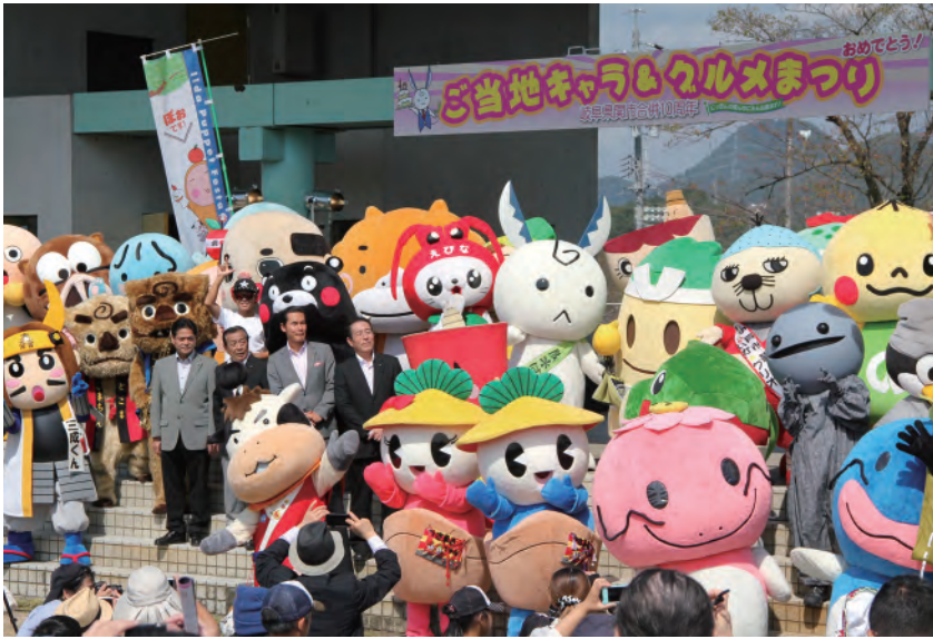
合併10周年ご当地キャラ&グルメまつり開催 全国各地から50体以上のご当地キャラと30点以上の絶品グルメが集結。約4万人の来場者で賑わいました。