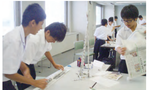
中学生理科数学コンテスト開催 市内中学校から23チーム69人が参加し、3人1組で協力して知恵を絞りながら、記述問題と工作に挑みました。