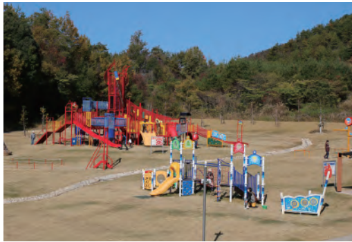
中池ファミリーパークオープン 中池公園の一角に、大型複合遊具や芝生広場などを整備した公園が完成。愛称は、公募により市内外から集まった177点の中から決定しました。