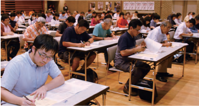
～刃物の知識を試し切り～ 第1回刃物検定「はもけん」開催 刃物の歴史や名称、製造工程、ご当地キャラ、ことわざなどから全50問が出題され、市内外から参加した106人が検定に挑みました。