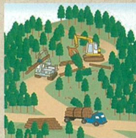
適切に森林整備を推進!

ことから、森林の土地の所有者の把握を進めるため、平成24年4月から森林法に基づく森林の土地の所有者となった旨の届出制度が創設されました。なお、この届出により、森林の土地の所有権の帰属が確定されるものではありません。