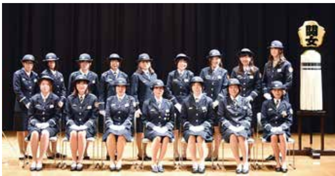
関市消防団女性分団のメンバー（創設時）

働いている方も、学生の方も、主婦の方も、多くの女性のチカラが消防団で輝いています!