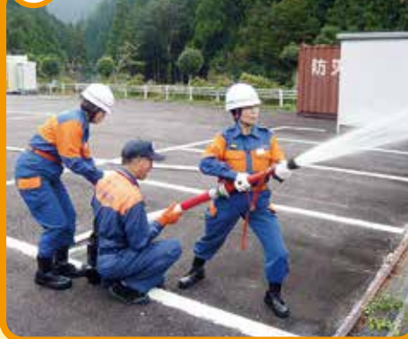
消火器、ポンプからの放水