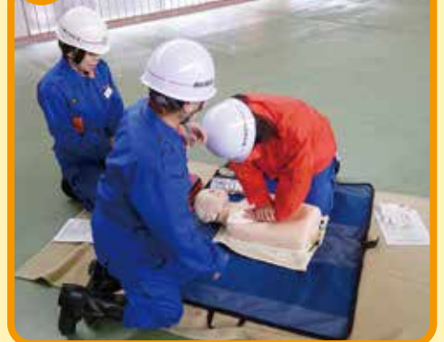
救急法などの研修