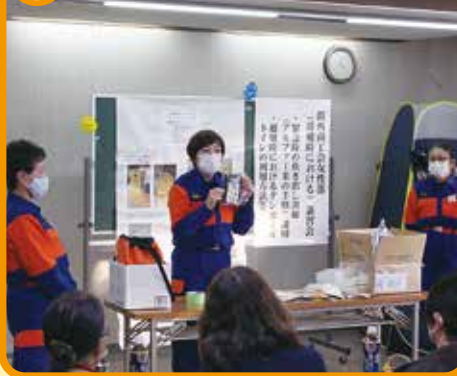
災害用トイレの説明