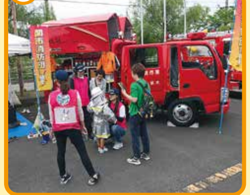
写真撮影のお手伝い