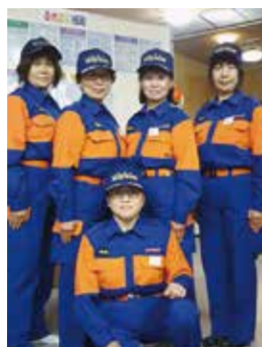
活動服もキマってます