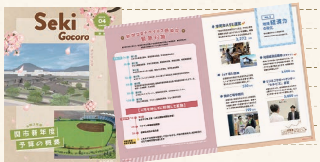
別冊 令和3年度 関市新年度予算の概要

コロナが落ち着きを見せているとはいえ(3月12日現在)、コロナ感染防止を図りながらの販売となります。販売期間の6月末までの間に、市役所での休日販売なども行いますので、焦ることなく密を避けながら購入していただくようお願いします。