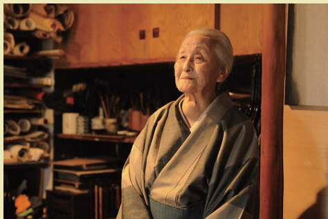
篠田桃紅（2010年）アトリエにて

期間 4月9日（金）～6月27日（日） 会場 関市立篠田桃紅美術空間 開館時間 午前9時～午後4時30分 休館日 月曜日（ただし5月3日は開館）、 4月30日、5月6日