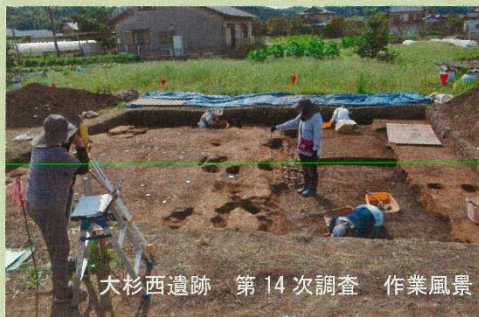
大杉西遺跡 第14次調査 作業風景