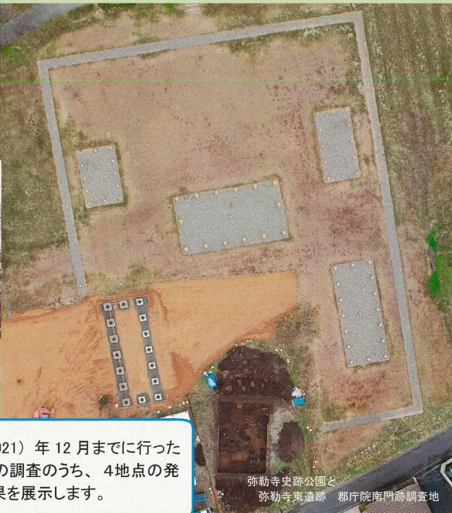
弥勒寺史跡公園と 弥勒寺東遺跡 郡庁院南門跡調査地