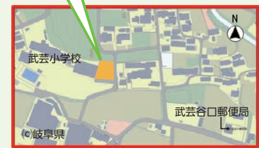
武芸小学校体育館前駐車場