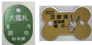
左：鑑札 右：令和4年度の注射済票

生後90日を経過した飼い犬の登録、毎年1回狂犬病の予防注射を受けさせること、鑑札・狂犬病予防注射済票を飼い犬に着けることは法律で義務付けられています。