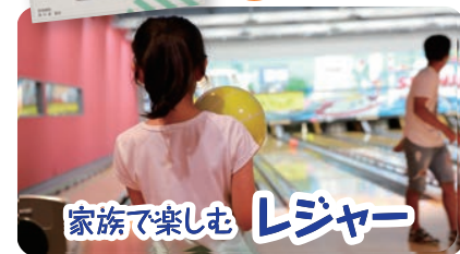
家族で楽しむ レジャー