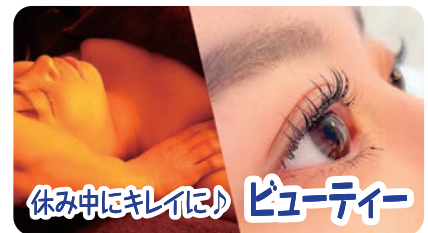
休み中にキレイに! ビューティー