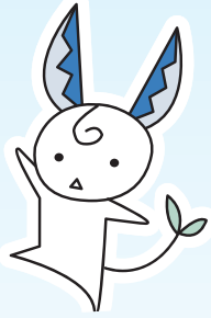
関市イメージキャラクター 「関*はもみん」