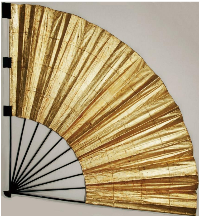
金扇馬標 久能山東照宮博物館蔵 【戦場で徳川家康の所在を誇示した扇】