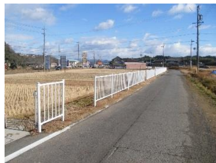
安全対策実施箇所