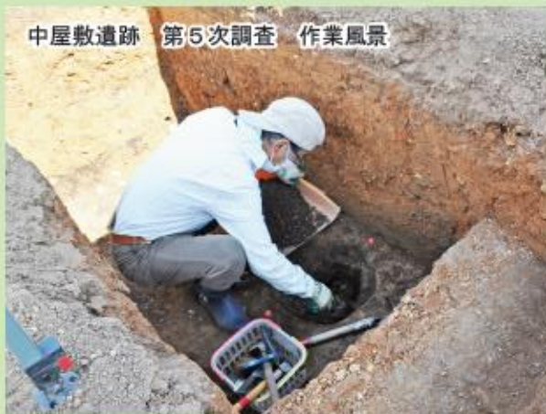
中屋敷遺跡 第5次調査 作業風景