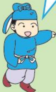
ひろまるくん (弥勒寺遺跡群 イメージキャラクター)

2022(令和4)年12月までに行った調査の結果や出土遺物を展示します。過去の調査結果も併せて紹介します。