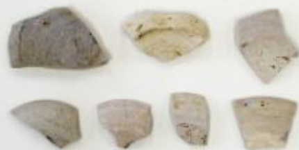
吉田沖遺跡 第21次調査 出土土器

2022(令和4)年12月までに行った調査の結果や出土遺物を展示します。過去の調査結果も併せて紹介します。