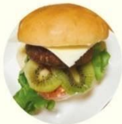
ほらたれバーガー