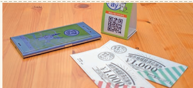
プレミアム付商品券は、詳細が決まりましたら広報等でお知らせします。