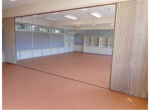
パソコン室の間仕切り工事 完了