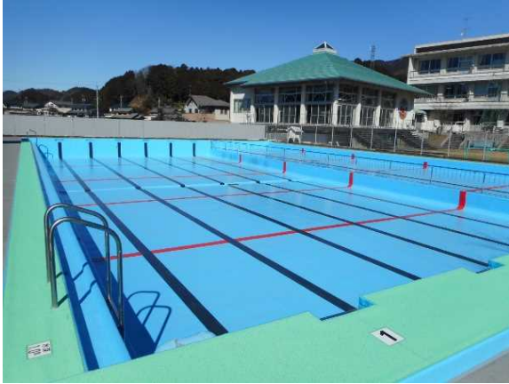
プール改修工事 完了

令和4年度において、プールの改修や特別支援教室の設備に伴いパソコン室の間仕切りを施工しました。令和5年度は、照明のLED化を予定しています。