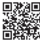
▲申込みはこちらから

申込方法 市ホームページから申込み (https://www.city.seki.lg.jp/0000016419.html) 照会先 市民健康課(☎24-0111)