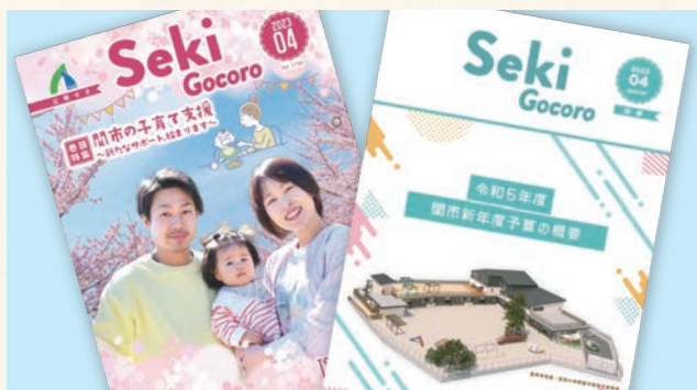
今号の巻頭特集と広報別冊、ぜひご覧ください。