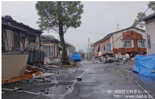
住家被害状況(熊本地震)

大地震が発生すると、家屋の倒壊や、地すべり、土砂崩れなどの災害が発生します。また、液状化、火災の発生、ライフラインが維持できなくなるなど二次災害の発生が予想されます。