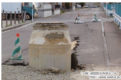
液状化によるマンホール等浮き上がり(東日本大震災)

地震による大きな揺れで地盤が一時的に液体状になる現象です。建物が傾いたり沈んだり、地下に埋設されている管路やマンホール等の浮き上がりが発生します。