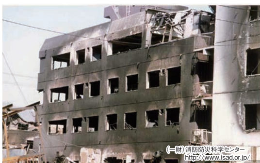
建物の延焼の様子(阪神淡路大震災)