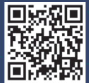
▲ 揺れやすさマップ