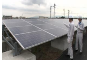
太陽光パネルの外観検査

使用済みとなった太陽光パネルについても、再販売可能なものもある。既に多くのリユース事例が報告されている。