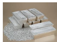
有用金属（銀）のイメージ