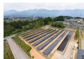
リユース品を使用した発電所