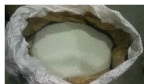
破碎・選別したガラス