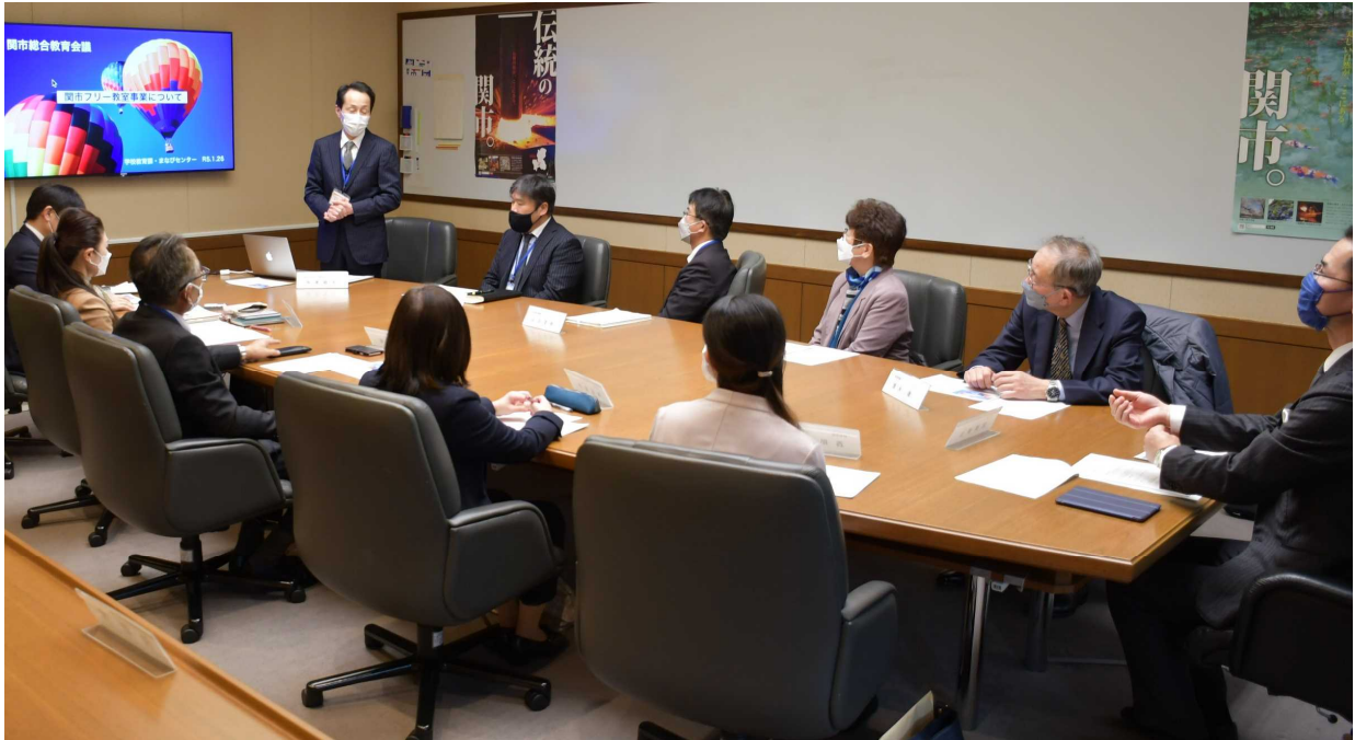
令和4年度 総合教育会議（1回開催）

関市教育委員会では、平成27年4月1日に施行された地方教育行政の組織及び運営に関する法律の改正に伴い、市長と幅広く意見交換を行う協議・調整の場と位置付けされた総合教育会議を開催しています。