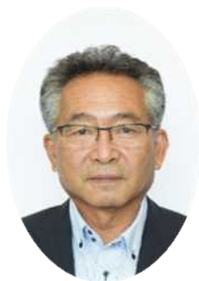
教育長 森 正昭