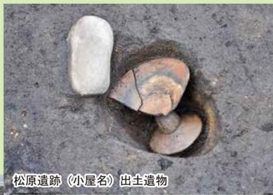
松原遺跡 (小屋名) 出土遺物