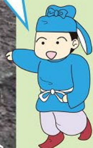
ひろまろくん (弥勒寺遺跡群 イメージキャラクター)