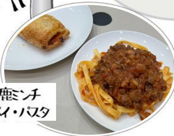
鹿ミンチ パイ・パスタ