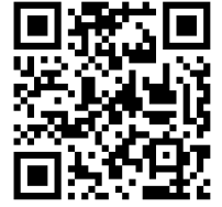
関鍛冶伝承館 トップページ

「FACERE施設Edition」は約50か国語の多言語翻訳機能や音声ガイド機能を備えたスマートフォン・Web サイトサービスです。 関鍛冶伝承館の来館案内やイベント情報、展示刀剣の紹介をはじめ、周辺の観光情報や歴史文化情報などを掲載し、より広く情報発信を行います。