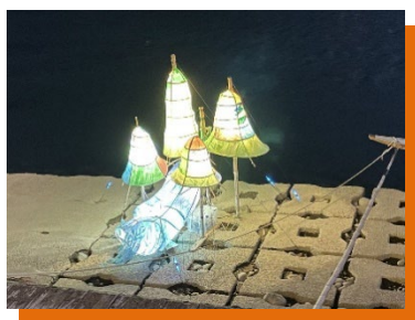
「ちーオシスタチュー」イメージ

関市の「ちーオシスタチュー」のデザインが決まりました。一緒に作ってくれる仲間を募集します。会場にずっといる必要はありません。途中からの参加でも、途中で抜けても大丈夫です。皆さんの参加をお待ちします。