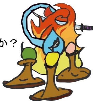
「ちーオシスタチュー」のイメージ図 これをスタチューにします。

次のステップとして、ちーオシを形にしたオブジェ「ちーオシスタチュー」を制作します。10月14日に開催される「清流の国ぎふ」文化祭2024の開会式で、天皇皇后両陛下のご臨席のもと、県内42市町村の「ちーオシスタチュー」が一挙に披露されます。