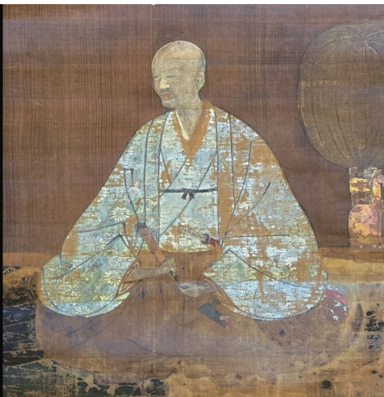
伝説の黒田長政肖像画(関市) 関鍛冶伝承館蔵 文政5年11月(日) 関市神社蔵