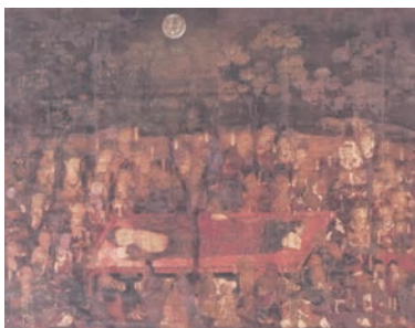
▲汾陽寺所蔵「絹本着色仏涅槃図」