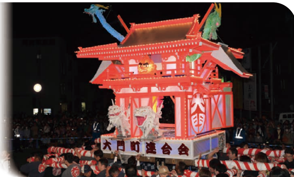
▲令和7年度 関まつり 特等(大門町自治会連合会)