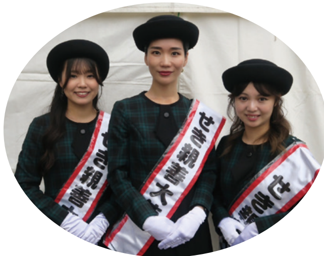
14代目せき親善大使