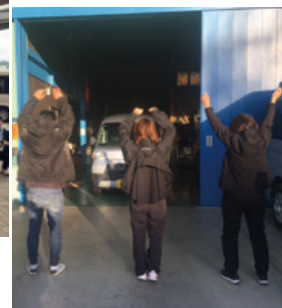
毎朝のラジオ体操