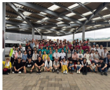
ボランティア活動(能登支援活動) 令和7年10月

ひいては、地域の皆さまと連携しながら笑顔あふれるまちづくりに貢献してまいります。