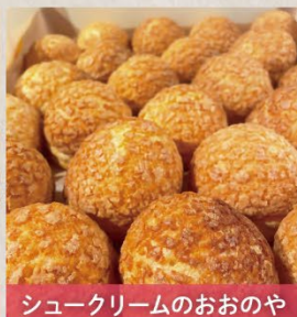
シュークリームのおおのや