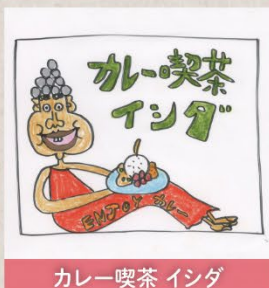
カレー喫茶 インダ