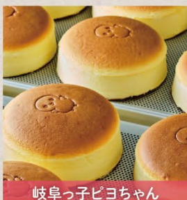
岐阜っ子ピヨちゃん