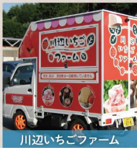
川辺いちごファーム