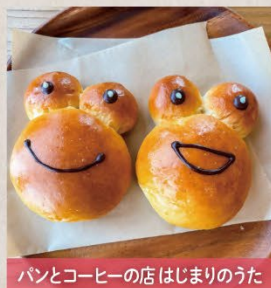
パンとコーヒーの店はじまりのうた