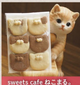
sweets cafe ねこまる。