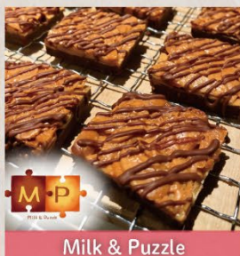
Milk & Puzzle