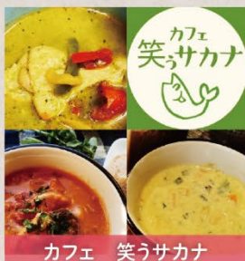
カフェ 笑うサカナ