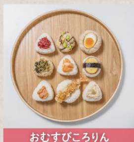
おむすびころりん