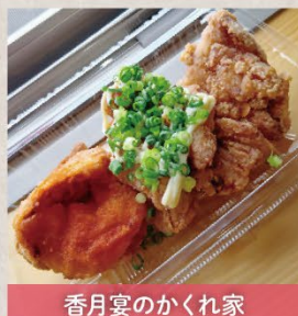
香月宴のかくれ家