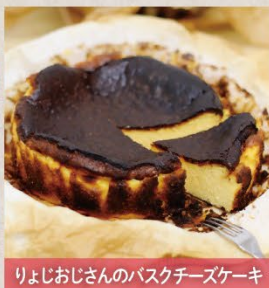
りよじおじさんのバスクチーズケーキ