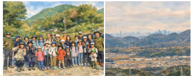
▲山頂からの景色イメージ

濃尾平野の最北端に位置する富野は豊かな自然に囲まれたほどよい田舎です。キャッチフレーズ「ほのぼのいきいき! わくわく富野」のもと、毎月の本城山登山や年2回の軽トラ市、夏のサマーフェスティバル、秋のふれあい文化祭、わくわく手作りカフェ、富野ふれあいファームなど、多彩な企画で交流とにぎわいづくりを進めています。また、高齢者の暮らしの不便を解消するために買物支援バスの運行やふれあいクラブによる支援活動を行い、居場所づくりや世代間交流の促進にも努めています。これらのイベント情報や活動の様子は、毎月発行の「とみのふれあいだより」とYouTubeチャンネル「富野ふれまち」で発信していますので、ぜひご覧ください。