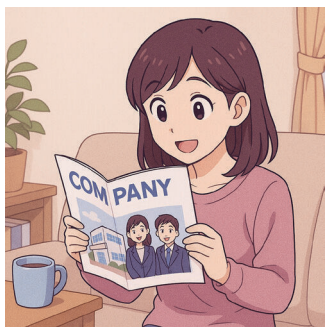
委託費及び印刷製本費の補助