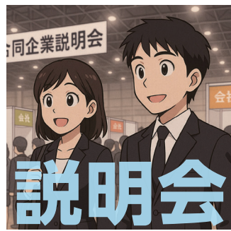
出展費、小間装飾費、広告宣伝費の補助