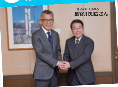
空き家対策をミッションとして新たな地域おこし協力隊員が活動を始めました。