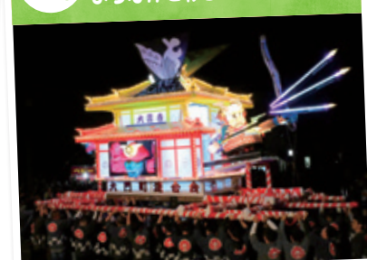
山車やあんどんみこしが、春のまちなかを練り歩きました。