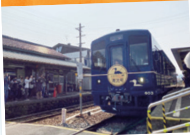
清流号のカラーは小瀬鷓鴣をイメージした濃い青色“ウカイブルー”。長良川鉄道の新しい仲間が誕生。