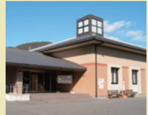
岐阜バス「武芸川温泉」前