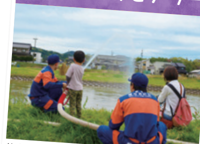
放水体験や救命体験など消防団の活動を身近に感じてもらうイベントを初めて開催しました。