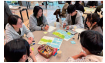
ユースセンター 公式Instagram ▶