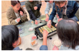
ユースセンター 公式ホームページ ▶

自己成長の場 自身の関心事について探求したり、イベントの企画・運営にチャレンジできる。