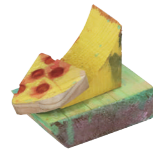
《すべるピザ》 岐阜県関市立下有知小学校 1年 三輪 美月 6×10×11cm