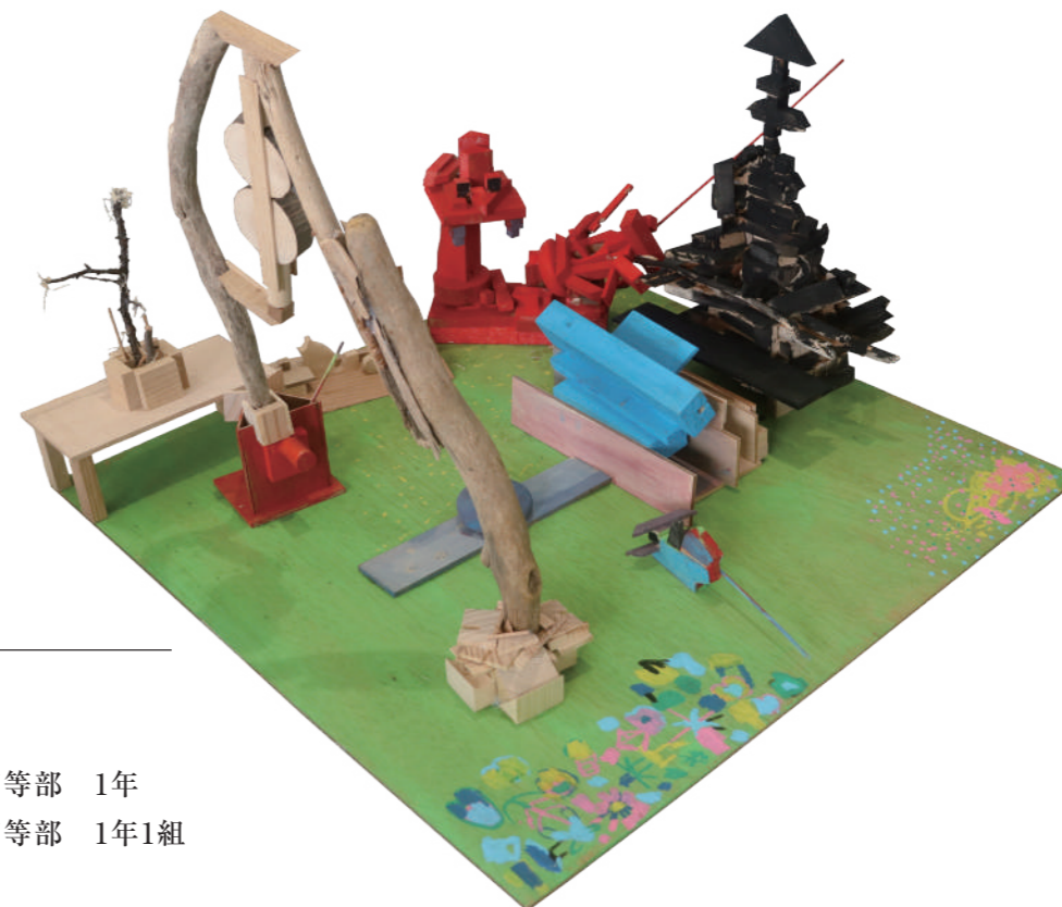
《へんな異世界》 岐阜県各務原市立 かかみがはら支援学校高等部 1年 かかみがはら支援学校高等部 1年1組 70×50×70cm